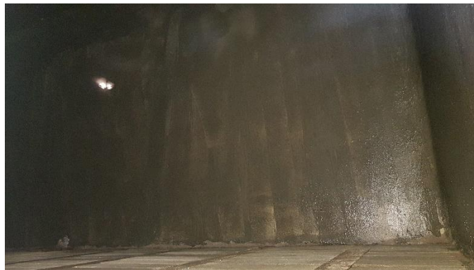
Ilustración 7 Depósito de agua con recubrimiento

ATENTEMENTE ADMINISTRACIÓN / MESA DIRECTIVA