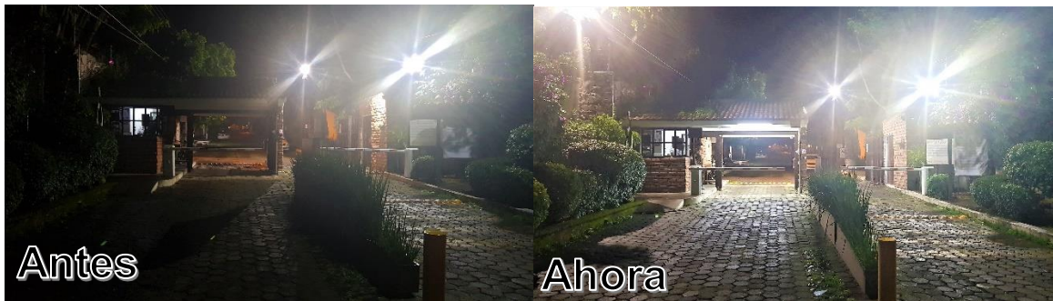
Ilustración 2 Comparación de iluminación

Además, se hicieron adecuaciones e instalaron nuevas lámparas y reflectores tipo LED, haciendo más eficiente el consumo de energía eléctrica y mejorando sustancialmente la iluminación en el área de la caseta de vigilancia tanto como hacia la salida como la entrada. En seguida se muestran unas fotografías donde se puede apreciar la mejora en iluminación.