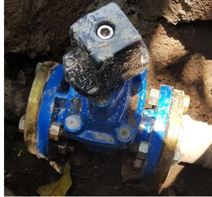
Ilustración 4 Válvula 2