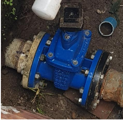
Ilustración 3 Válvula 1