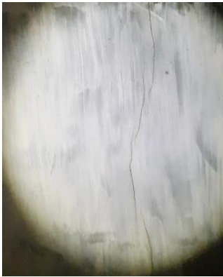
Ilustración 6 Grieta de depósito