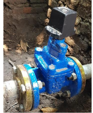
Ilustración 5 Válvula 3